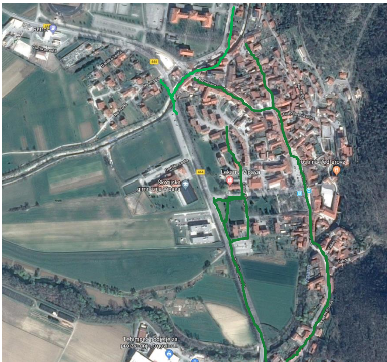
Slika 5: Vipava center, Vir: Google zemljevidi

Varna šolska pot po manj prometnih ulicah s pločnikom v centru Vipave.