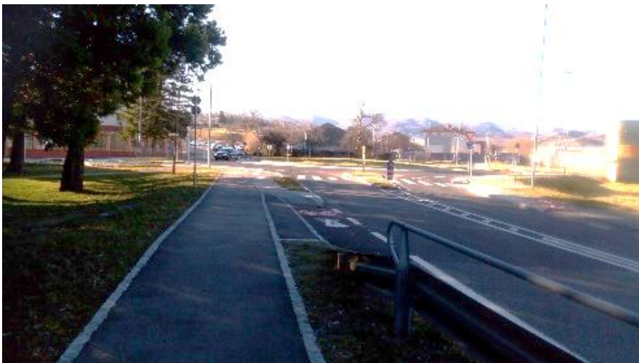
Slika 12: Prehod kolesarske poti iz krožišča kolesarja usmerja na glavno cesto