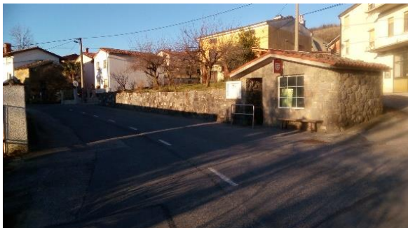
Slika 15: Avtobusno postajališče v Mančah