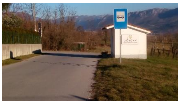
Slika 18: Avtobusno postajališče na Slapu