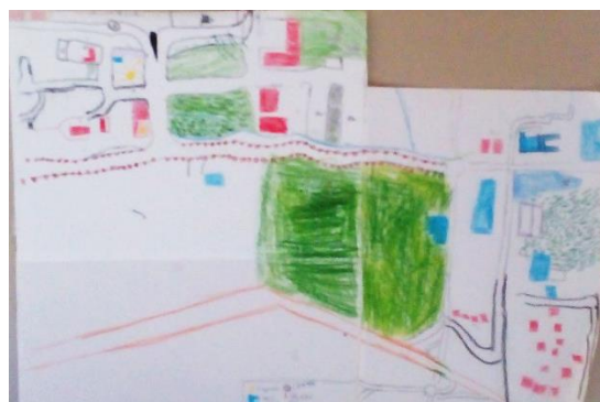
Slika 2 (Varna pot v centru Vipave)