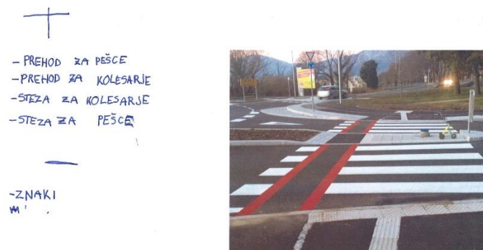
Slika 4 (Varna pot – kolesarska steza v krožišču)

Otroci, ki so sopotniki v osebni vozilu ali na šolskem avtobusu, se morajo med prevozom vedno pripeti z varnostnim pasom. Pri vstopu in izstopu iz vozila so pozorni na promet na parkirišču. Do vhoda v šolo ali na parkirišče hodi po pločniku in cesto prečka na prehodu za pešce.