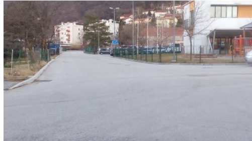
Slika 7: Od vrtača proti šoli je urejen nizek pločnik