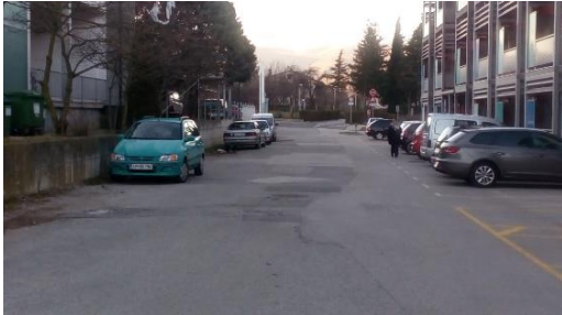
Slika 6: Ni pločnika ali drugih talnih oznak