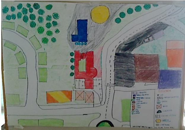
Slika 3 (Varna pot v okolici šole)

Ugotovili so, da so v prometu najbolj izpostavljeni predvsem mlajši otroci kot pešci in starejši otroci in mladostniki, kot kolesarji.