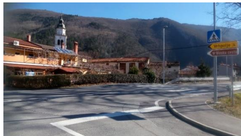
Slika 11: Varno čez glavno cesto proti centru Vipave