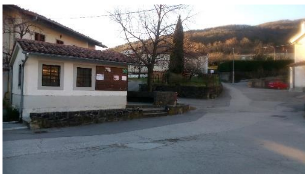
Slika 14: Avtobusno postajališče v Podragi