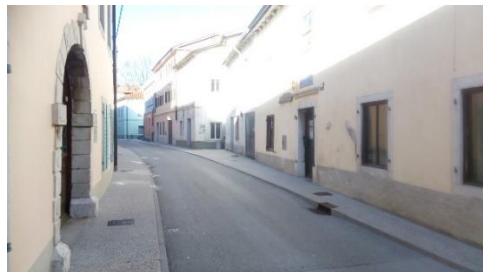
Slika 9: Pločnik v centru Vipave