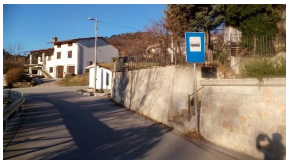
Slika 17: Avtobusno postajališče na Slapu