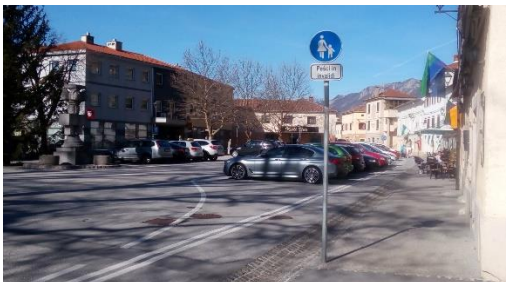
Slika 10: Pločnik v centru Vipave