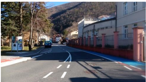
Slika 8: Talne oznake za pešpot proti centru Vipave