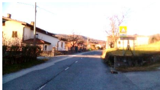
Slika 16: Manče