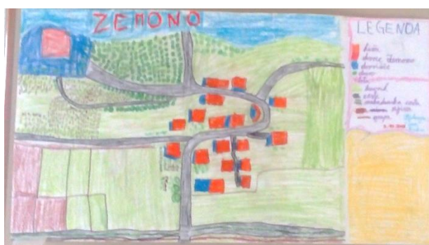
Slika 1 (Varna pot na Zemonu)

Učenci 5.b so izdelali zemljevide domačega kraja in vrisali varne učen poti ter se pogovorili o poteh, ki so varne tudi za kolesarje.